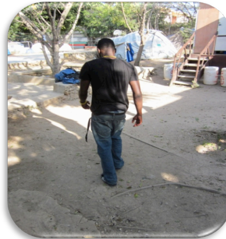
ETAP 11: Gaz kole!