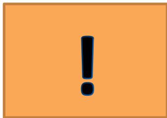
ETAP 4: Kaka! Twalèt!