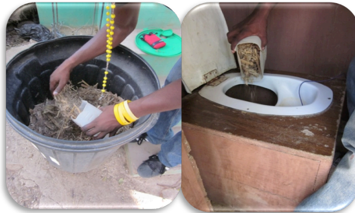
ETAP 8: Pran bagas la, vide l nan twou kote twalèt la tonbe a