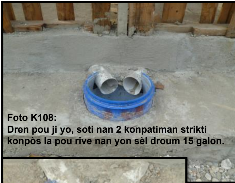
Foto K108: Dren pou ji yo, soti nan 2 konpatiman strikti konpòs la pou rive nan yon sèl droum 15 galon.