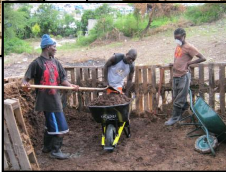
Foto K213 a, b, c:

Deplase yon pil konpòs a la men pran anpil tan, se anpil travay e sa koute chè.