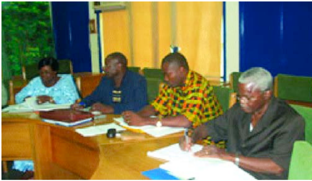
Séance du travail du comité du pilotage de CREPA Burkina

Ainsi, on remarque que des ateliers de plaidoyers ont été organisés ici et là avec à l'appui des posters et des dépliants élaborés à cet effet. A cela, il faut également ajouter l'organisation d'un atelier régional ECOSAN et architecture, lequel atelier a permis de mobiliser tous les ordres nationaux des architectes des 10 pays impliqués dans le programme ECOSAN.