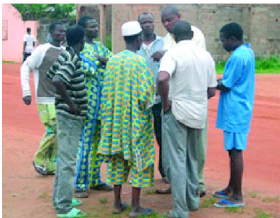
Séance de concertation pour le choix des animateurs hommes endogènes (Bénin)

ou avec les fonds propres du CREPA, 484 latrines familiales et 20 blocs de latrines scolaires ont été construites au profit des populations. Des mécanismes endogènes pour la réalisation d'ouvrages ont été développés dans le but de faciliter l'acquisition de latrines par les populations. Selon le contexte, des subventions, variant entre 40 et 60%, sont accordées sur le coût des ouvrages avec une participation en nature du bénéficiaire. Les promoteurs du projet en collaboration avec les bénéficiaires, mettent en place des comités locaux pour le suivi des ouvrages. Les membres du comité sont chargés de la sensibilisation des leurs sur ECOSAN et sur les différentes thématiques d'AEPHA.