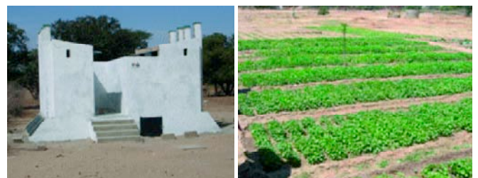
Latrine scolaire (Vue de face) et Périmètres Ecosan à Keur daouda Cissé (Sénégal)

Dans les RN, des tentatives innovantes sont entreprises dans les projets. L'approche ECOSAN est intégrée dans les écoles (Bénin, Côte d'Ivoire, Niger, Mali, Sénégal, Togo) suivant la stratégie d'intervention du CREPA en milieu scolaire. Des ménages, déjà bénéficiaires des latrines ECOSAN, sont continuellement formés à l'utilisation de l'urine et des excréta hygénisés sur les superficies maraî-