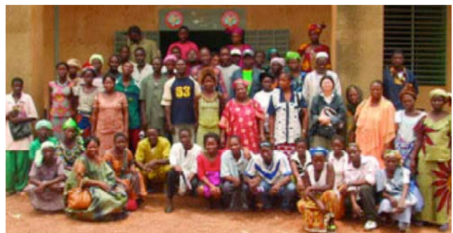
Relais formés à Banfora (Burkina Faso)

Considérant que l'amélioration de l'accès aux ouvrages passe par la formation de relais communautaires et d'artisans locaux, environ une centaine de relais communautaire et 173 maçons ont été formés en technique de construction de latrines ECOSAN et de marketing des ouvrages. En partenariat