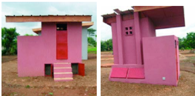
Latrine associée à une douche à Tiémélékro (Côte d'Ivoire) construite par CREPA CI et Architectes Sans Frontières

A côté de ses travaux de recherche théorique, des recherches pratiques sont faites sur les ouvrages en vue d'améliorer le design et le confort des latrines ECOSAN.