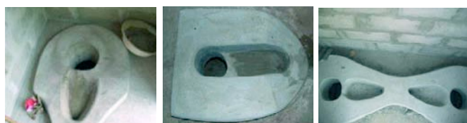
Innovations apportées sur le design des cuvettes par des artisans maçons formés au Bénin

Au regard de l'engouement des populations, surtout des communautés paysannes pour l'acquisition de latrines ECOSAN, il est aisé de constater que la stratégie CREPA couplant l'assainissement à l'amélioration de la productivité agricole a fait des latrines ECOSAN, un des ouvrages d'assainissement les plus prisés en milieu rural. Il va sans dire qu'il faille toujours veiller à la formation des artisans et des