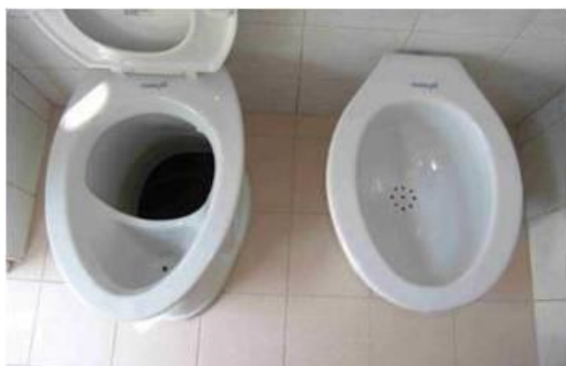
Figure 3: Inodoro seco estándar con separación de orina

El criterio principal para el buen funcionamiento de un baño seco es la prevención de la contaminación cruzada de la orina y las heces.