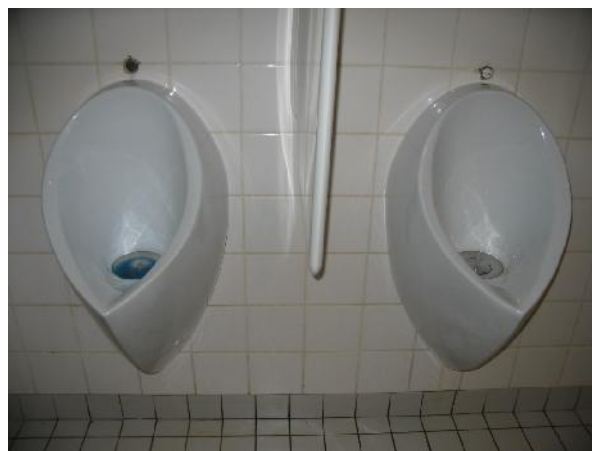
Figure 4: Mingitorios secos en un baño público

cante como cal, aserrín, cenizas o tierra a las heces para lograr un incremento en el pH y una disminución en la humedad.