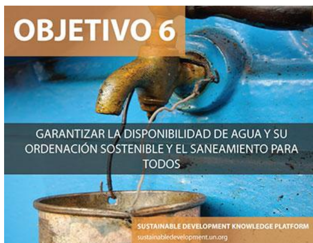
Figure 2: Objetivo 6 SDGs: Saneamiento para todos. ( http://www.un.org/sustainabledevelopment ).

Del mismo modo, luego de la cumbre Rio+20, los países miembro de las Naciones Unidas han suscripto nuevas metas para el desarrollo sostenible universal a alcanzar para el año 2030; entre ellas se encuentran el aseguramiento de la disponibilidad y gestión sustentable del agua y saneamiento para todos los habitantes (Objetivo 6 / Figura 2).