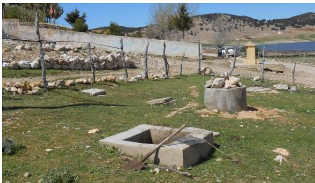
Figure 3: Digesteur classique à Dayet Ifrah, Maroc. A l'avant-plan: bac d'alimentation des eaux usées et fumiers; au centre: sommet du dôme du digesteur.