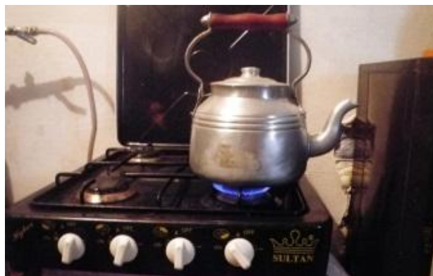
Figure 4: Cuisinière à biogaz à Dayet Ifrah, Maroc.