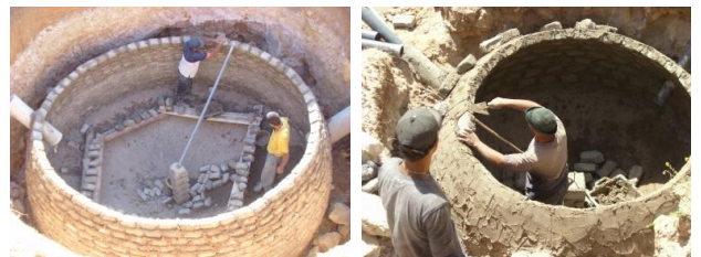
Figure 2: Construction de digesteurs pour une ferme, école et mosquée à Dayet Ifrah, Maroc.