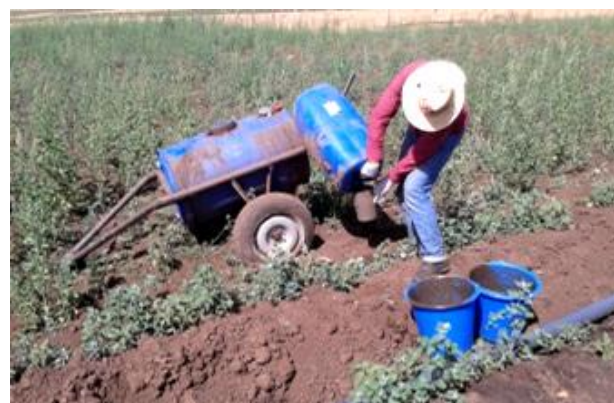
Figure 5: Epannage de digestat au jardin d'essai à Dayet Ifrah, Maroc (source: M. Wauthélet, 2013).