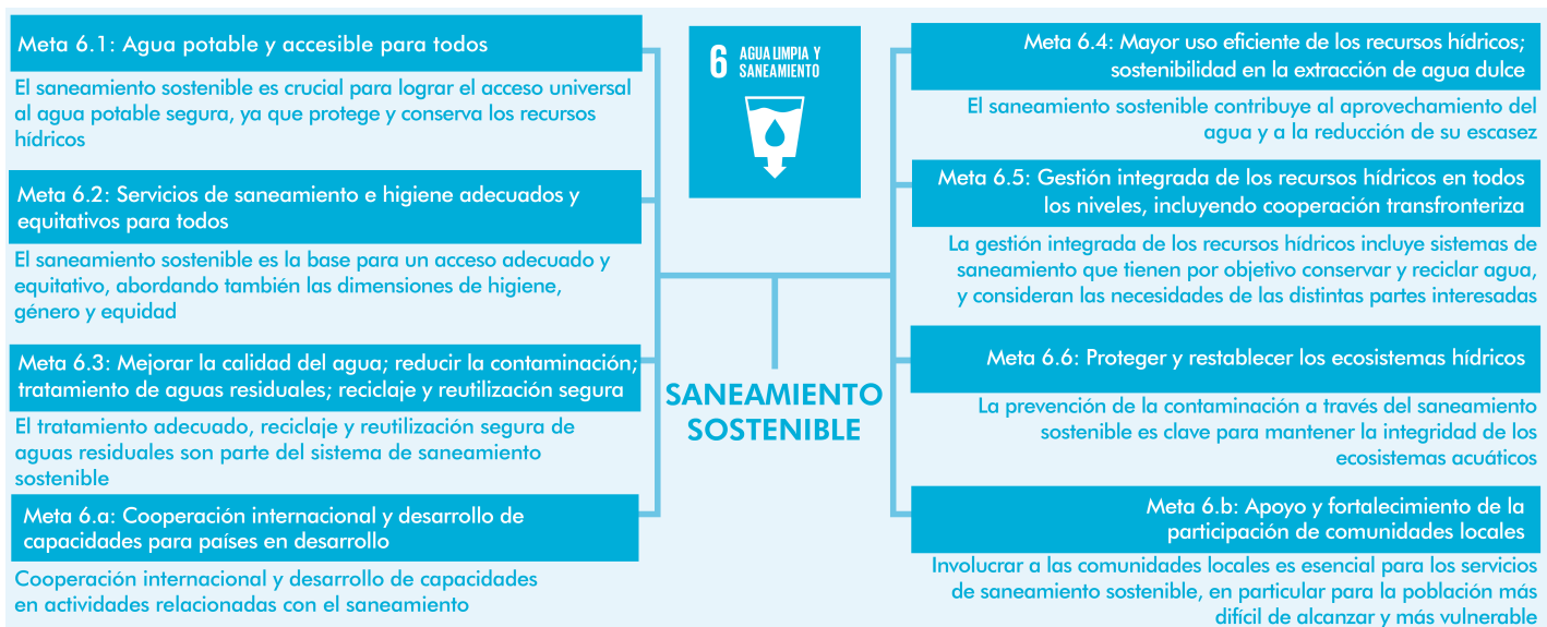
Figura 1: Interconexiones entre saneamiento sostenible con las metas del ODS 6

El reconocimiento de las interrelaciones y la naturaleza integrada de los ODS es crucial para garantizar que los objetivos de la Agenda 2030 se cumplan con éxito. Los estrechos vínculos entre el saneamiento y las numerosas metas en todos los ODS revelan el papel fundamental que desempeña el saneamiento en el logro de los ODS y ofrece nuevas oportunidades para que SuSanA se acerque y colabore con otros sectores (enfoques multisectoriales de WASH). La mayoría de las interrelaciones entre los ODS se refuerzan mutuamente, pero también pueden existir potenciales conflictos que deben ser gestionados.