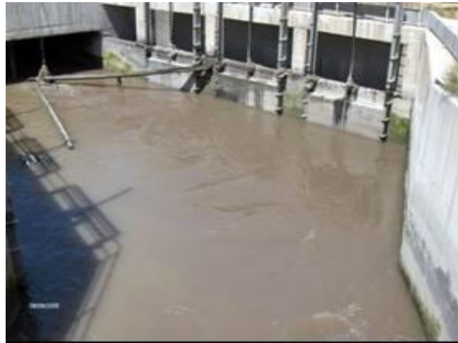
الشكل رقم (2) مياه الصرف الصحي ضمن الأقتية المخصصة لها

تشكل مياه الصرف الصحي ما يقدر بحوالي 70 - 75 % من إجمالي المياه المستعملة المخصصة للاستعمالات المنزلية والصناعية، أي ما مقداره حوالي 1.463 مليار م 3 .