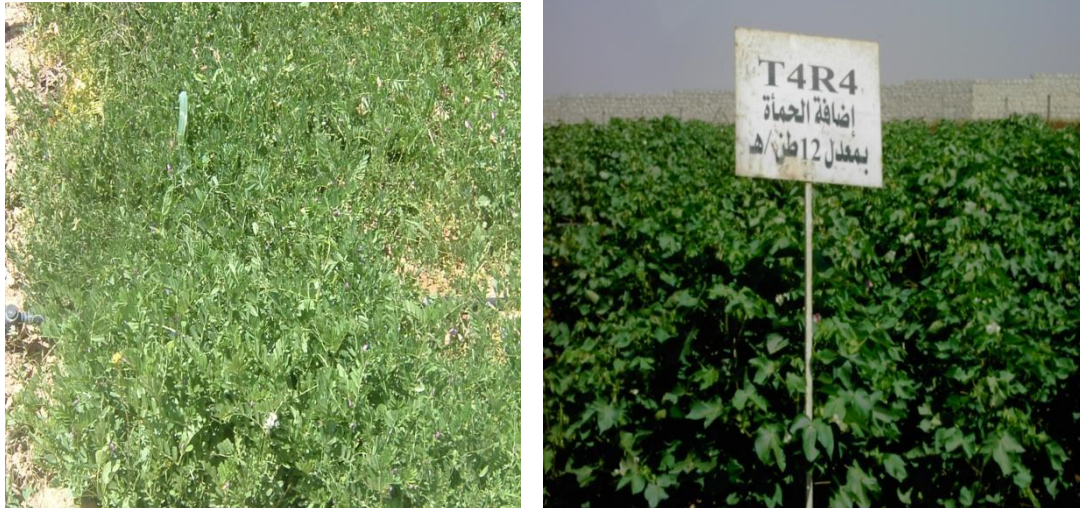
الشكل (12) تسميد القطن والبيقية العلفية بالحمأة

6.4. تأثير استعمال الحمأة في إنتاجية ونوعية بعض المحاصيل: استعملت حمأة الصرف الصحي في العديد من دول العالم كمحسن ومخصب للترب وكسماد عضوي عند زراعة العديد من أنواع المحاصيل والأشجار سواء المثمرة أو الحراجية، وأبدت تلك النباتات استجابة عالية وكبيرة عند تسميدها بمخلفات الصرف الصحي الصلبة، فقد أضيفت تلك المادة للترب المزروعة بالمحاصيل الحقلية كالقمح والشعير والذرة الصفراء وللمحاصيل الصناعية كالقطن، وأيضاً العلفية كالبيقية والفصة والبرسيم، كما أضيفت لتسميد بعض أنواع الأشجار كالزيتون وغيرها. وفي سورية فإن عملية التخلص من الحمأة الناتجة من مختلف محطات المعالجة في المحافظات باتت تشكل مشكلة بيئية وزراعية واقتصادية وصحية واجتماعية كبيرة، وتعددت المسؤوليات بشأن الطرائق الآمنة للتخلص من هذا المنتج، حيث استعملت الحمأة على نطاق محدد وضيق في سورية وأجريت عدة بحوث ودراسات حول الاستعمال الآمن لتلك المادة وتحديد الكميات المناسبة لإضافتها للتربة الزراعية، ورصد الآثار البيئية الضارة بالموارد الطبيعية من تربة ونباتات ومياه وفي الصحة العامة.