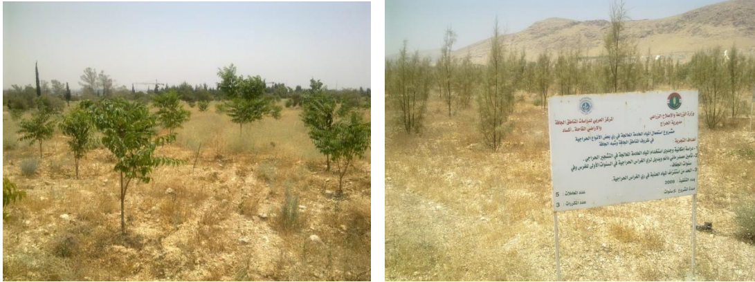
الشكل (10) استعمال المياه المعالجة في ري الغراس الحراجية