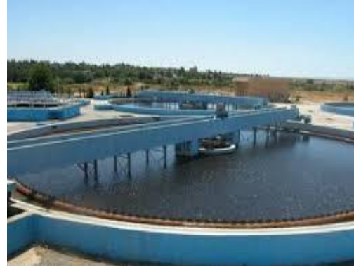
الشكل (4) بعض محطات معالجة مياه الصرف الصحي في سورية