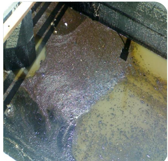
الشكل (7) طرح مخلفات معاصر الزيتون والزيتون الصناعية والفيول والزفت في مجرى مياه الصرف الصحي