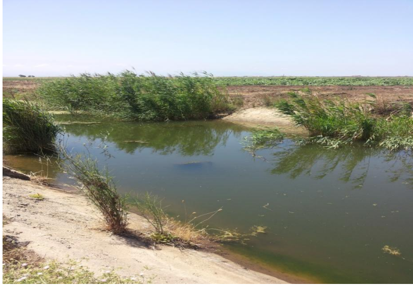
الشكل (1) قنوات تجميع مياه الصرف الزراعي

2.2.1. مياه الصرف الصحي والصناعي (Wastewater (Domestic and Industrial): تعد مياه الصرف الصحي المصدر الرئيس للمياه غير التقليدية التي يمكن إعادة استعمالها بعد المعالجة لأغراض الري الزراعي والأغراض الأخرى. وقد حددت مساحة الأراضي المقرر ريها في جميع المناطق التي تم إنشاء محطات معالجة مياه الصرف الصحي فيها ويمكن زيادة هذه المساحة في حال استعمال تقنيات الري الحديثة كالري بالرش والتنقيط بدل استعمال الري بالغمر المطبق في الوقت الحاضر.