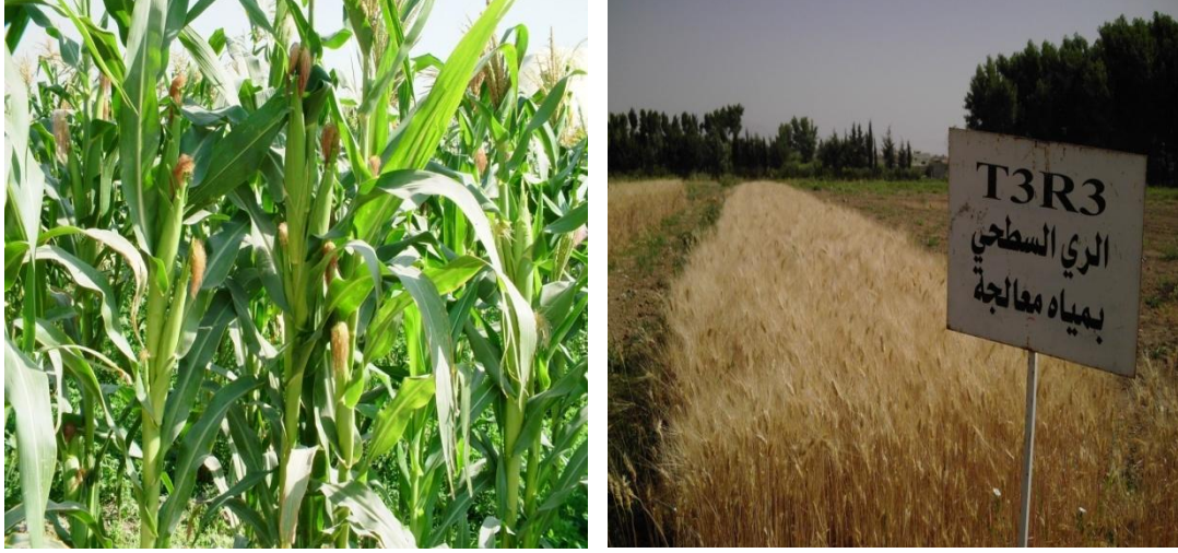
الشكل (9) ري القمح والذرة الصفراء بالمياه المعالجة

وقد أبدت تلك النباتات استجابة عالية للري يمثل هذه المياه التي تحتوي على تراكيز جيدة ومتفاوتة من العناصر السمادية المغذية والضرورية لنمو وإنتاج النبات. وأعطت مردوداً اقتصادياً جيداً وأعلى من مردود تلك المحاصيل المروية بمياه الأنهار أو المياه الجوفية، حيث تراوحت نسبة الزيادة في المردود بين 10 و 50% (جزدان، 2002؛ جزدان، 2011؛ جزدان، 2014).