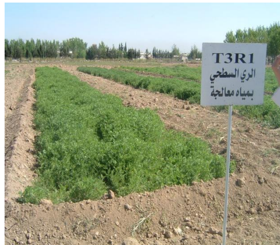
الشكل (8) ري البيقية العلفية والقطن بالمياه المعالجة