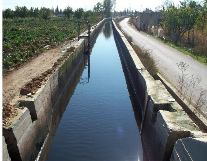
الشكل (5) قناة المياه المعالجة في غوطة دمشق

واستناداً إلى المواصفة القياسية السورية رقم (2752) لعام 2008 وحسب معطيات الجدول (5) يمكن القول أن المياه المعالجة في دمشق تقع جميع خصائصها الكيميائية والخصوبية ضمن تلك المواصفة والمعايير والحدود المسموح بها لأغراض الري الزراعي.