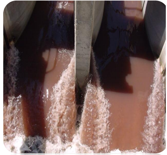
الشكل (6) مخلفات معامل الأصبغة والدهانات والمنظفات