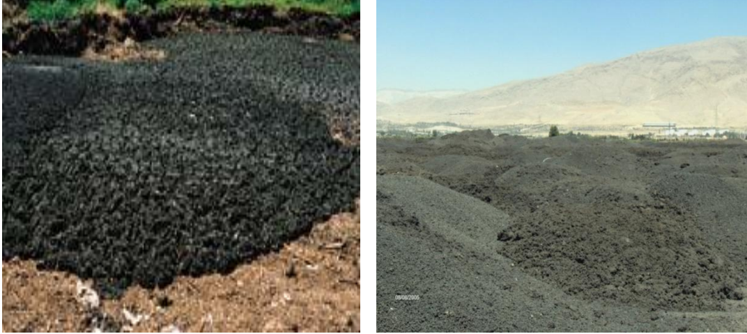
الشكل (11) الحمأة المتراكمة في محطات المعالجة

تعد الحمأة من أهم المنتجات الثانوية الناتجة من معالجة مياه الصرف الصحي، وهي آخذة في الزيادة عاماً بعد عام نتيجة لتزايد عدد السكان في العالم وزيادة عدد محطات المعالجة المنتشرة في معظم الدول، حيث تقدر كميات الحمأة بـ 25 - 40 كغ/سنة لكل مواطن، وفي الوطن العربي تقدر كمية الحمأة بنحو 5 مليون طن بالسنة. وقد بلغت كميات الحمأة الجافة المنتجة في سورية نحو 200 ألف طن/سنة في عام 2000 [هيئة الطاقة الذرية السورية، 2001] بينما وصلت في نهاية عام 2011 إلى نحو 550 ألف طن/سنة [وزارة الاسكان والتعمير، الشركة العامة للصرف الصحي، 2011].