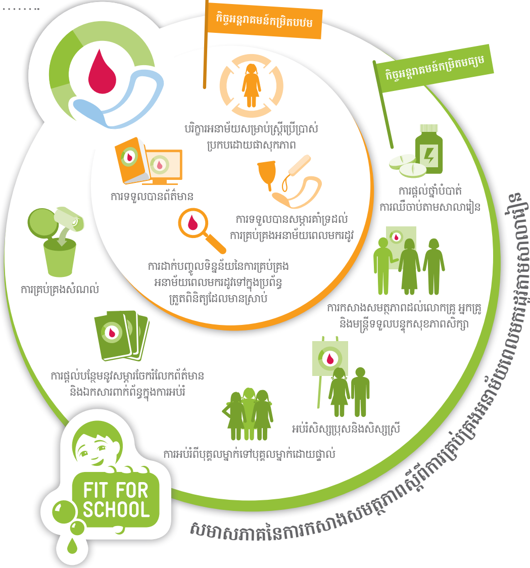
សមាសភាគនៃការកសាងសមត្ថភាពស្តីពីការគ្រប់គ្រងអនាម័យពេលមករដូវតាមសាលារៀន