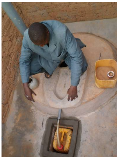
2. Veiller à ce que l'urine aille dans le bidon et les selles dans la fosse.