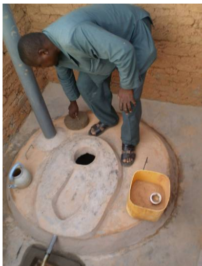
1. Enlever le couvercle.