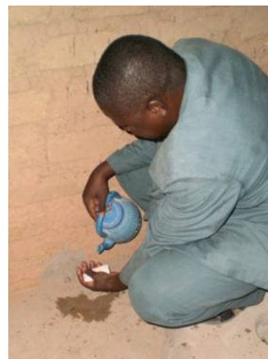
6. Laver les mains avec du savon ou de la cendre après chaque utilisation.