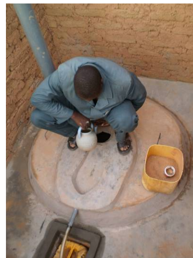
3. Veiller à ce que l'eau de nettoyage aille dans la fosse.