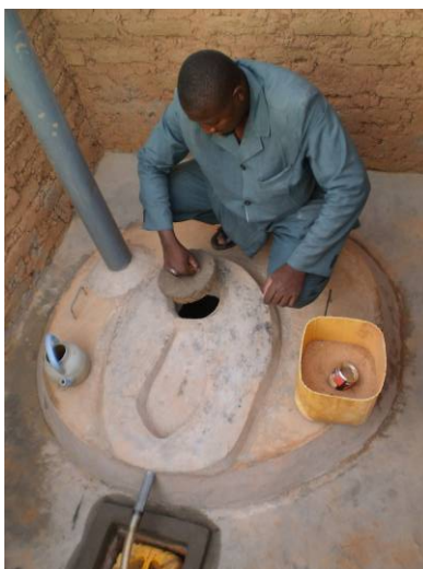
5. Remettre le couvercle.