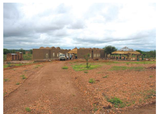
Vue partielle du village écologique de Tougan