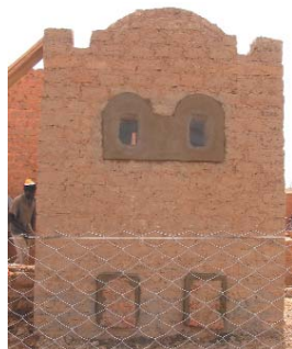
Latrine ECOSAN "sans bois"

- cuvette de défécation à la turque (position accroupie) ; - architecture conforme à celle des logements du village écologique, à savoir la technique de la construction sans bois, entièrement en banco, y compris les fosses de stockage des fèces. Ce modèle a été installé au niveau du réfectoire.