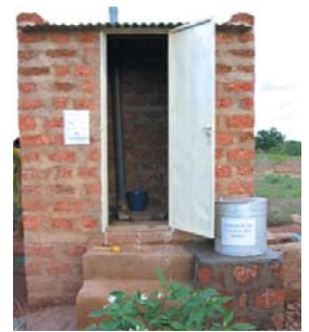
Latrine ECOSAN en pierre taillée

Cette variante, construite au niveau des dortoirs, n'a pas pu bénéficier de la technologie sans bois, à cause de l'indisponibilité d'ouvriers spécialisé à la matière.