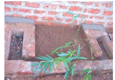
Dispositif de filtration des eaux de douche : un bambou est planté à la sortie

Quant aux douches réalisées au niveau des dortoirs, il s'agit de 2 blocs comportant chacun 2 douches et 1 latrine de type de la variante 2, avec un mini système de traitement (couches horizontales de gravier et de sable) et de réutilisation des eaux grises dans un petit jardin potager comprenant pour le moment des bambous. Des arbres fruitiers peu encombrants (papayer par exemple) y seront plantés également.