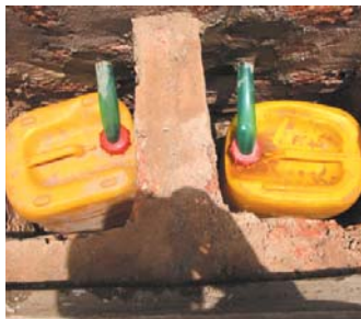
Bidons de collecte des urines