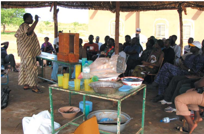
Séance d'animation avec un groupe de jeunes campeurs

Les supports de communication utilisés sont multiples (maquettes des ouvrages, affiches, brochures sur l'utilisation et l'entretien des ouvrages, publications des résultats de la recherche, communications orales powerpoint).