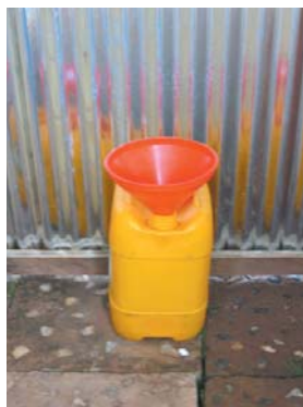
Bidon d'urine en famille

Les bidurs ont été installés dans une dizaine de ménages à titre de démonstration. Il convient de signaler qu'ils sont régulièrement utilisés et suscitent un engouement. Des demandes ont été exprimées comme celle de la direction provinciale de l'environnement pour leur kiosque à café.