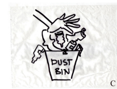
C. Put inorganic garbage in dust bin

ማንኛውንም አይነት ኢንኦርጋኒክ ቆሻሻ ወደ ሽንት ቤት ቀዳዳዎች አይጨምሩ