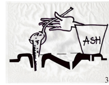
3. Add ash after use