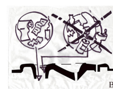
B. Do not add any inorganic garbage in any holes

ማንኛውንም አይነት ኢንኦርጋኒክ ቆሻሻ ወደ ሽንት ቤት ቀዳዳዎች አይጨምሩ