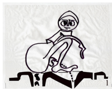
1. Position your self properly; do not mix urine and faeces