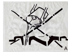
A. Add no liquid to the faeces hole