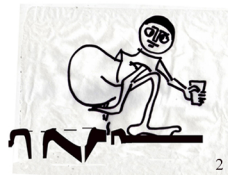
2. Use third hole for cleaning