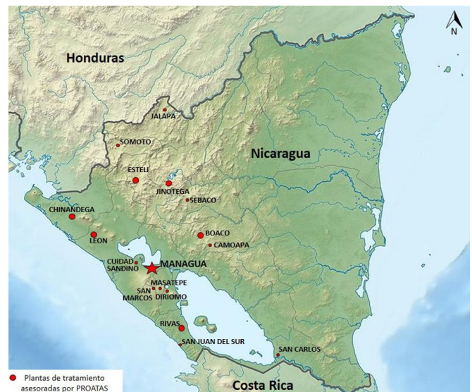
Mapa: Ubicación de las Plantas asesoradas por PROATAS