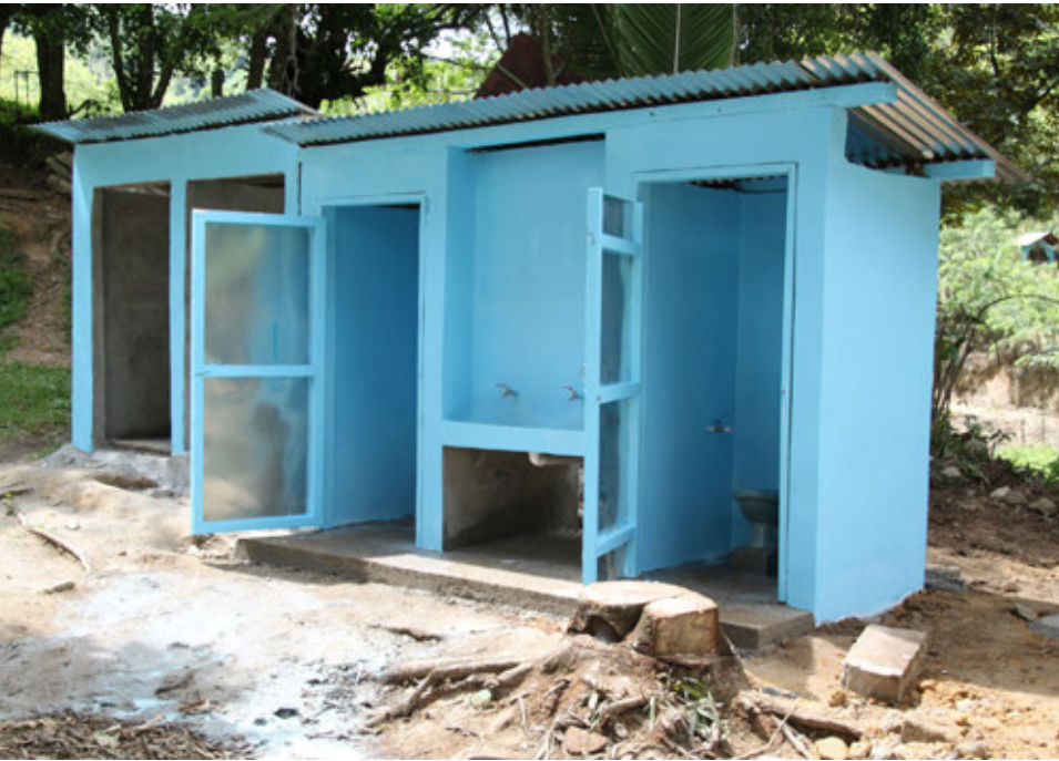
Inodoros escolares con una estación de lavado de manos.

Las paredes antes se hacían de planchas de metal (con las cuales es más rápido construir) pero comenzaban a oxidarse después de tres o cuatro años. El diseño nuevo usa ladrillos de adobe. Luego, nos dimos cuenta de que los ladrillos de adobe no eran lo