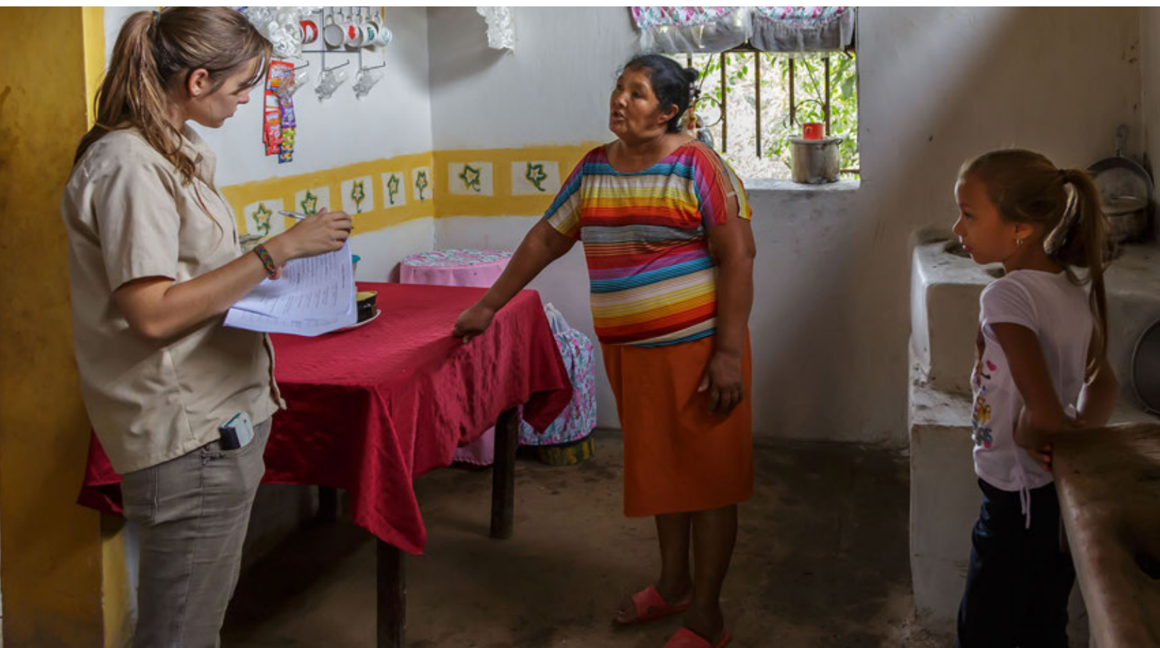
Personal de APPM realizando una visita de monitoreo