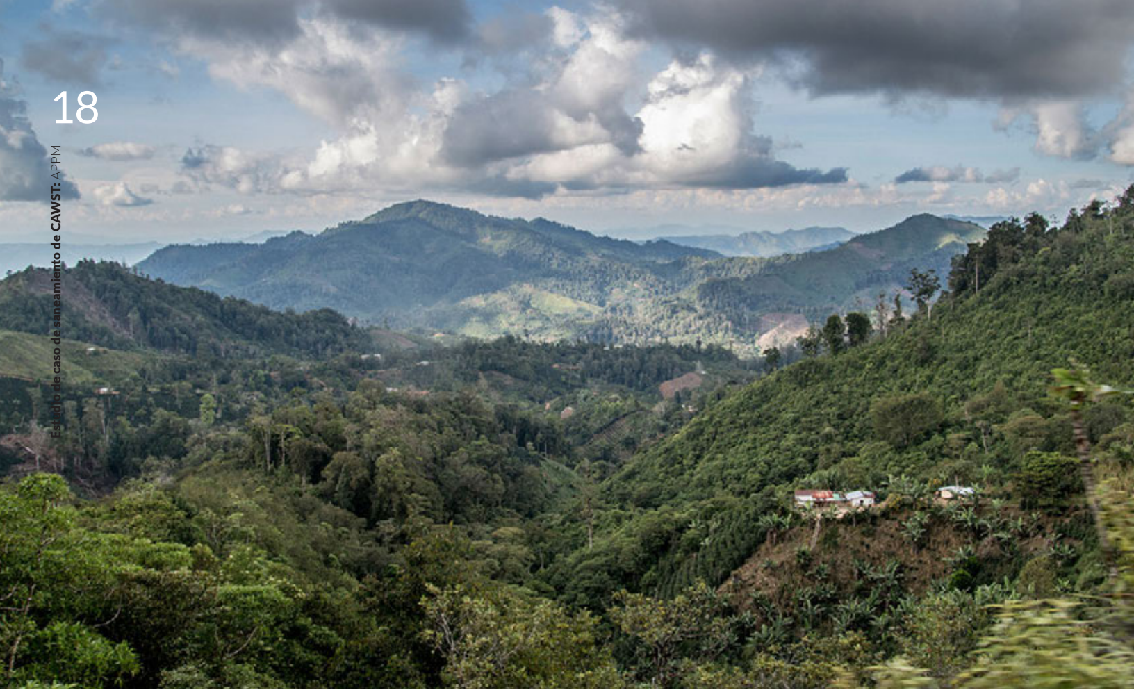
Paisaje de Trojes