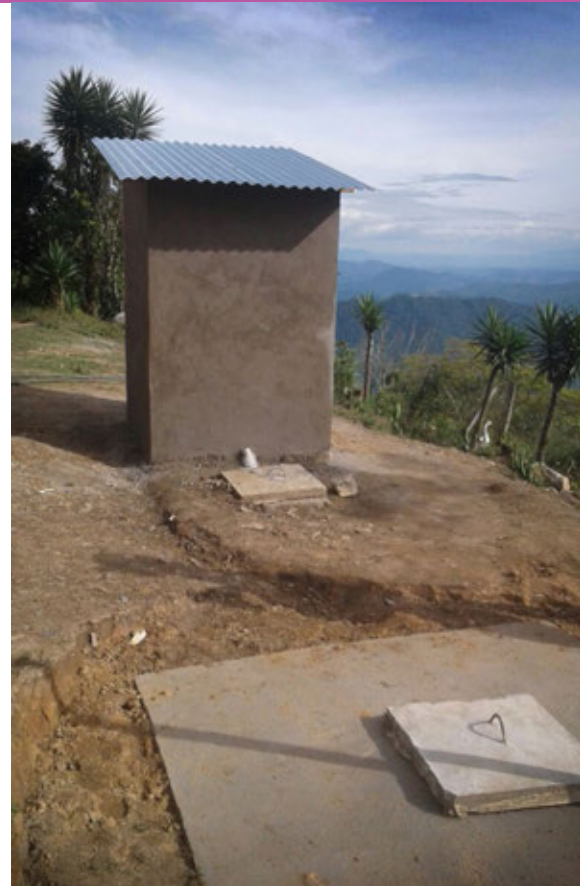
Inodoro de descarga manual con caja de distribución y fosa simple.

Para hogares con agua, promovemos los inodoros de descarga manual. Estos tienen fosa simple o fosas gemelas (con una caja de distribución), situada a 2-3 metros